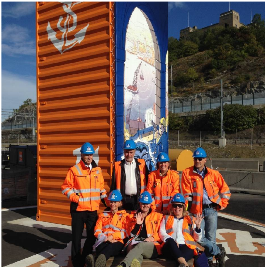
Havnestyret 7. juni 2016